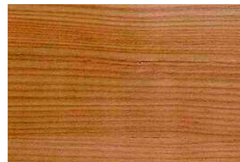
mélèze N° 110-89