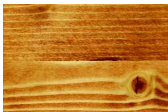
teck N° 110-81

La pluie, le soleil et l'usage journalier peuvent endommager le bois. Les rayons du soleil peuvent occasionner un grisonnement des terrasses en bois et l'humidité, propice à la prolifération des algues et des champignons, peut les rendre disgracieuses. Protégez vos terrasses en bois grâce à une huile, qui régule le taux d'humidité, tout en protégeant contre les rayons du soleil et qui forme une couche facile d'entretien.