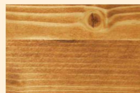
Teck N° 102-81